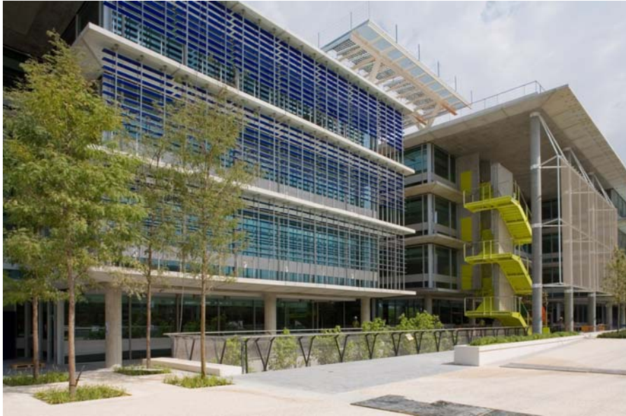
Campus de Palmas Altas, Sevilha, Espanha