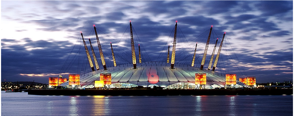
Millennium Dome, Londres