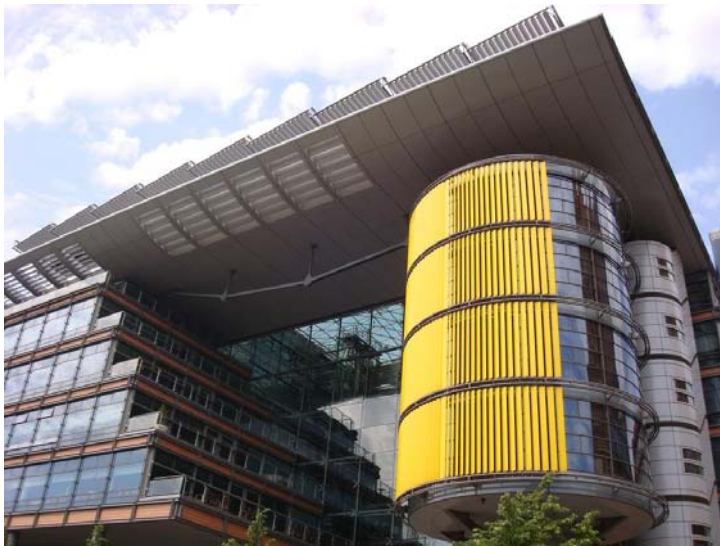
Daimler Chrysler, Berlim, Alemanha