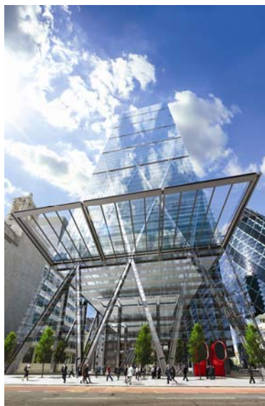
The Leadenhall Building, Londres