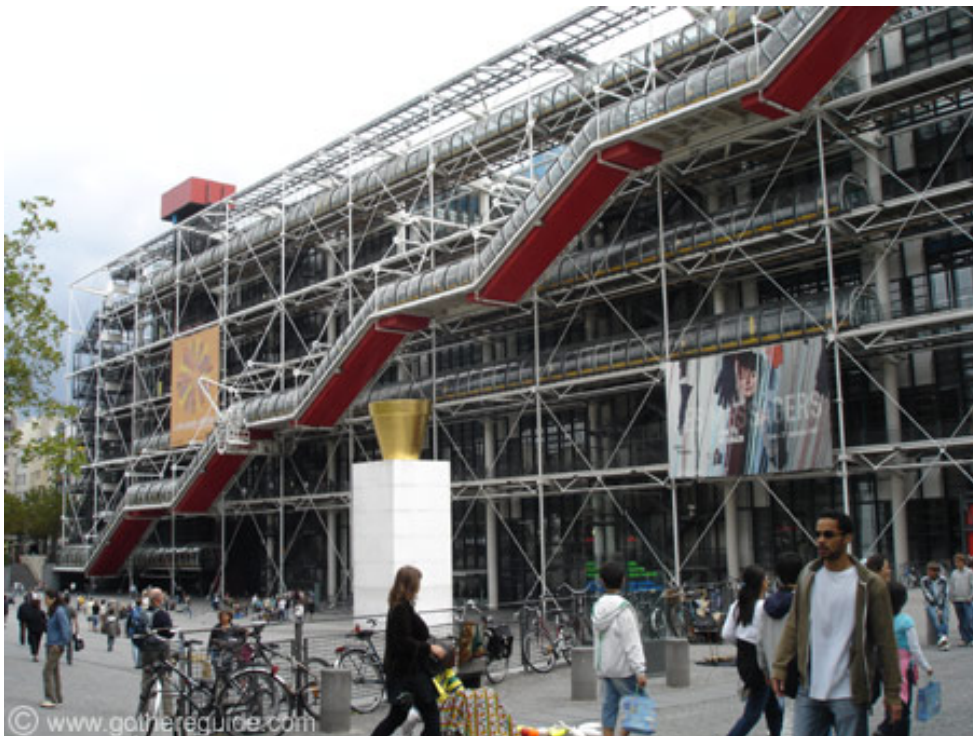
Centro Pompidou, Paris