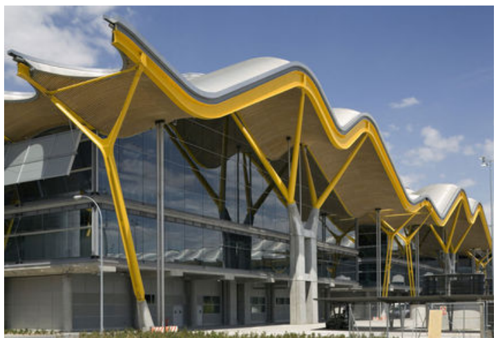
Aeroporto Internacional de Barajas, Madrid