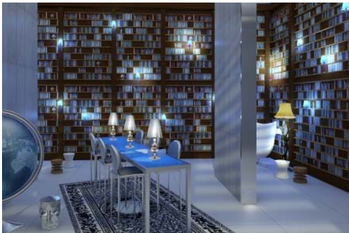
Yoo, Panama City