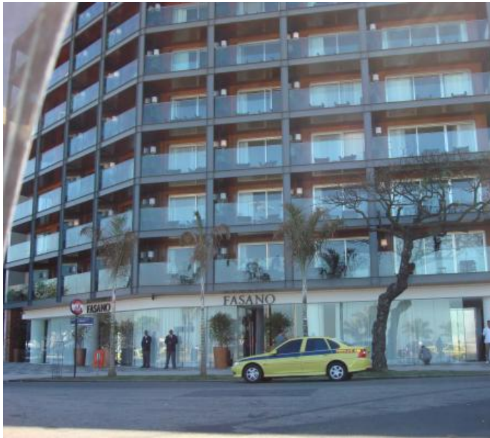
Hotel Fasano, Rio de Janeiro