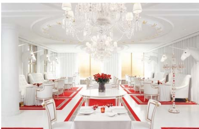
Faena El Porteno Hotel, Buenos Aires