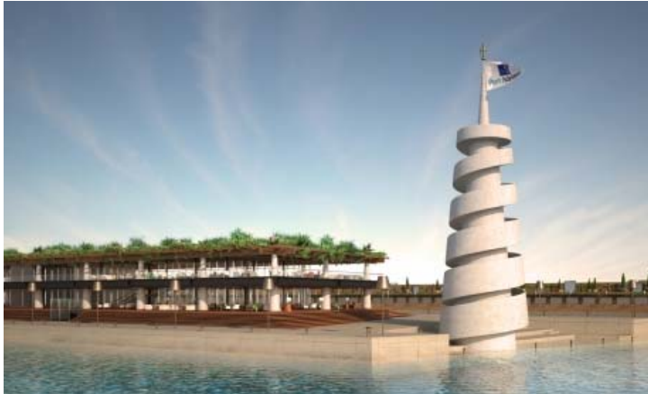
Port Adriano, Mallorca