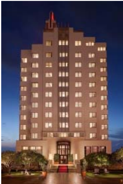
SLS Hotel, South Beach, Miami