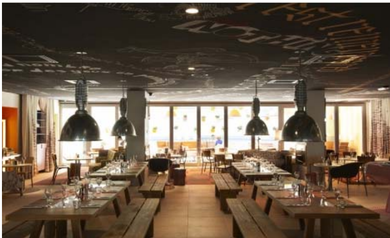
Hotel Mama Shelter Marseille