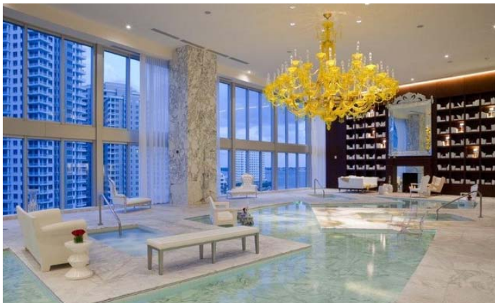
Icon Brickell, Miami